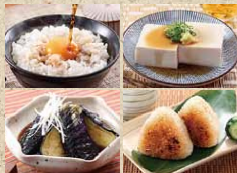
※このチラシの表示価格はすべて税込金額です。※写真はイメージです。 1410_500